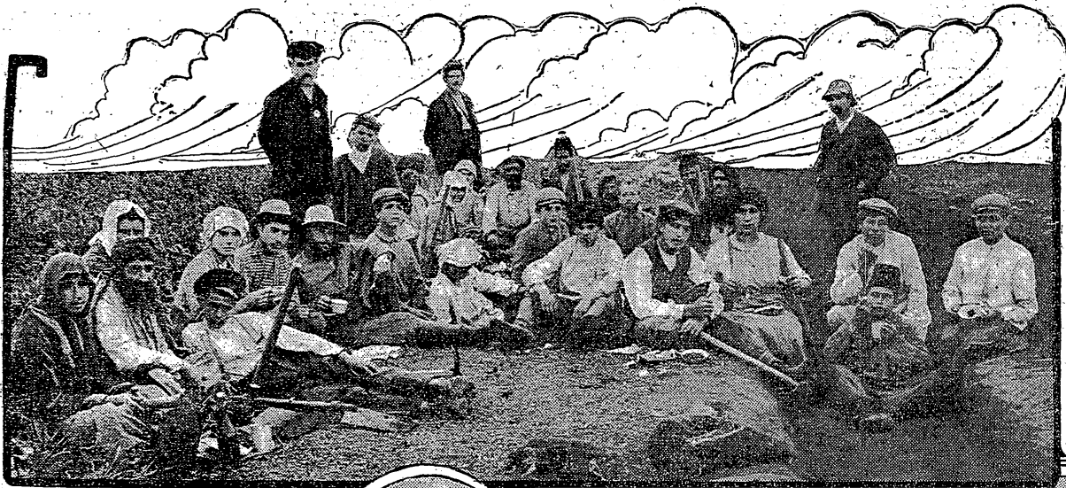
Colonists of Poreah Resting After Work.

WHEN the Balkan allies and their humbled Turkish foe get down to actual terms of settlement in the conference of their emissaries in London the problem confronting Europe will be not so much how to restore peace—war and cholera and famine have virtually done that already—but rather how to keep the white dove hovering